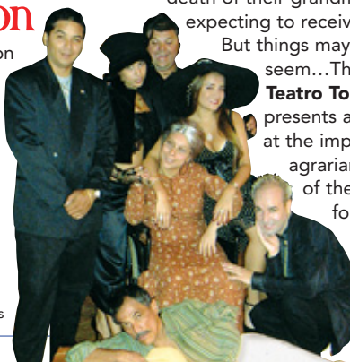
Teatro Tocando Puertas