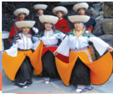
Coro Nueva Esperanza 2000. Virgen de la Nube

Sábado, 15 de septiembre • 2 pm Música y Baile