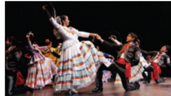
Calpulli Mexican Dance Company