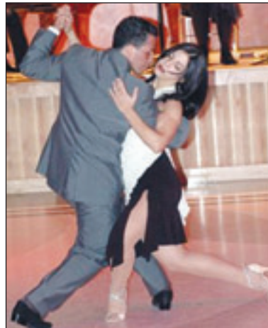
A Taste of Tango